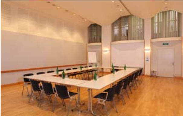
Fischer mit U-Form-Bestuhlung