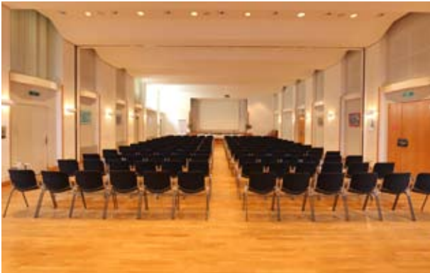
Fischer/Hodler mit Konzert-Bestuhlung

In diesen beiden Sälen stehen Ihnen alle Möglichkeiten offen. Dank der mobilen Bühne eignet sich die Kombination Fischer/Hodler besonders gut für Konzerte und grosse Events. Die Schiebewand erlaubt die Trennung der Räume – ganz nach Ihren Bedürfnissen.