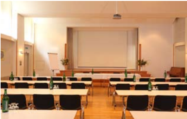
Hodler mit Seminar-Bestuhlung